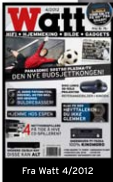
Fra Watt 4/2012

De to omtrent 22 cm store bassene er av aluminium, og der hvor Elac tidligere benyttet relativt enkle membraner har de nå utstyrt veldig mange av sine modeller med det de kaller for «Crystal-membraner». For å øke stivheten kraftig, og dermed hindre oppbrytninger i den hørbare delen av arbeidsområdet, har elementene fått membraner med en helt unik overflate-form. Dette gir klare forbedringer i elementets oppførsel opp mot det punktet de skjøter sammen med