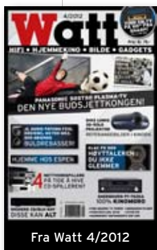
Fra Watt 4/2012