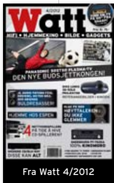
Fra Watt 4/2012